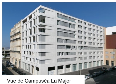
Vue de Campuséa La Major

« Campuséa La Major », une résidence pour étudiants dernière génération sur la façade portuaire de Marseille